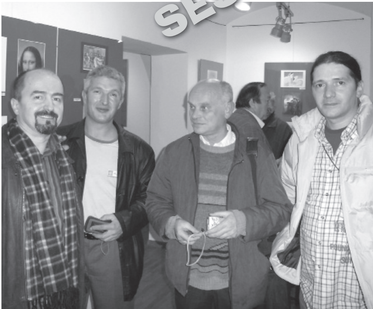
Detalj s otvaranja izložbe

Ovogodišnja 12. Međunarodna izložba karikature Zagreb 2007. na temu KRIVOTVORINA, preselila se na novu lokaciju. Nakon što je u lipnju ta izložba boravila u prostoru Klovićevih dvora sada su se najbolji autori iz 50 država svijeta predstavili građanima Seseveta. Mjesto održavanja izložbe bilo je u Muzeju Prigorja.