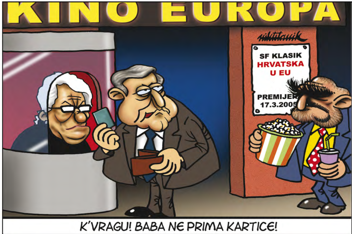
Prva objavljena karikatura u dnevnom listu "24sata", 2. ožujka 2005.