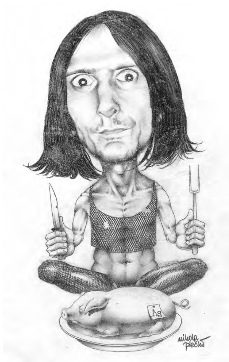
Prva objavljena karikatura u studentskom časopisu "Puls", 1994.