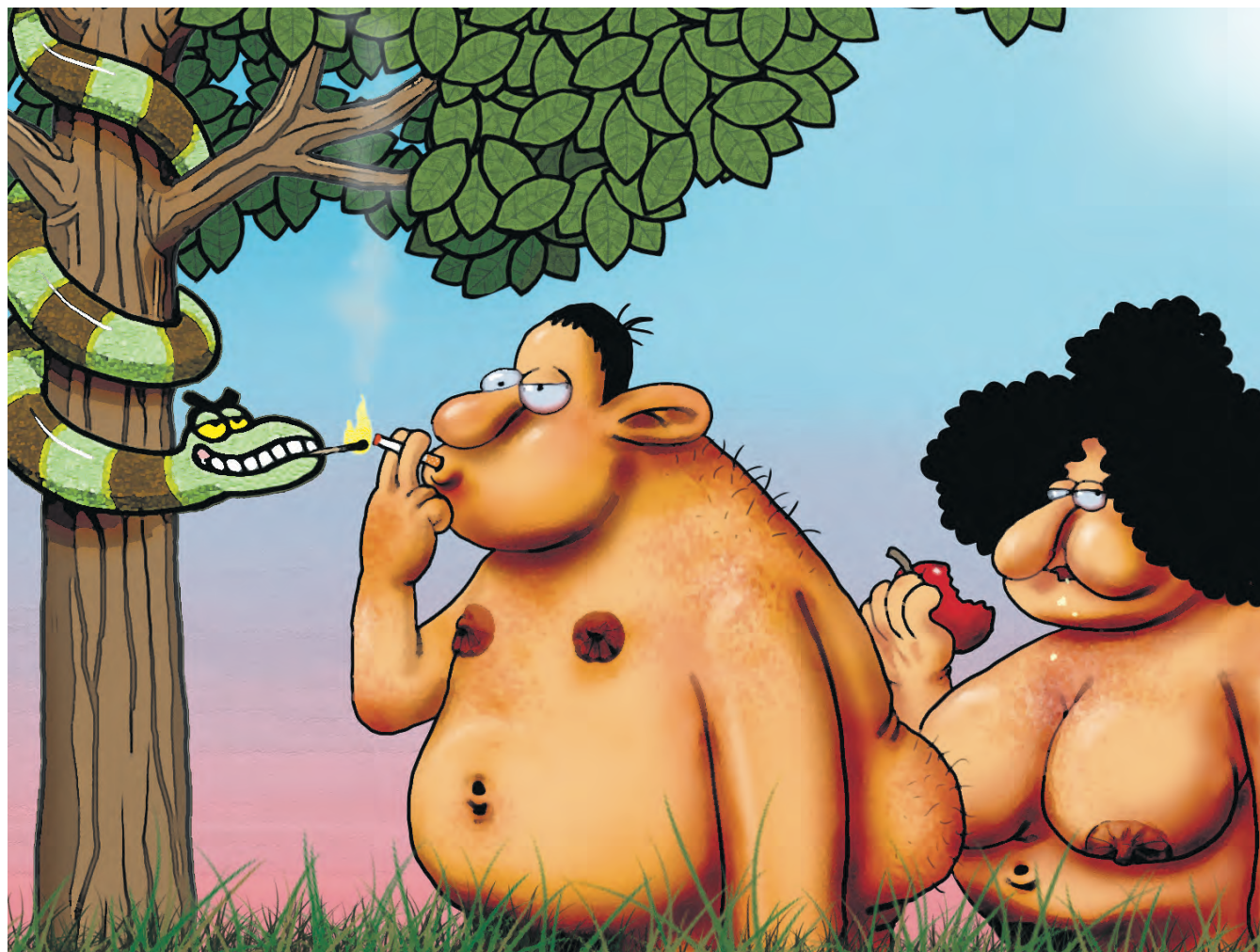
Posebno priznanje na Međunarodnom festivalu karikature ZAGREB 2011.