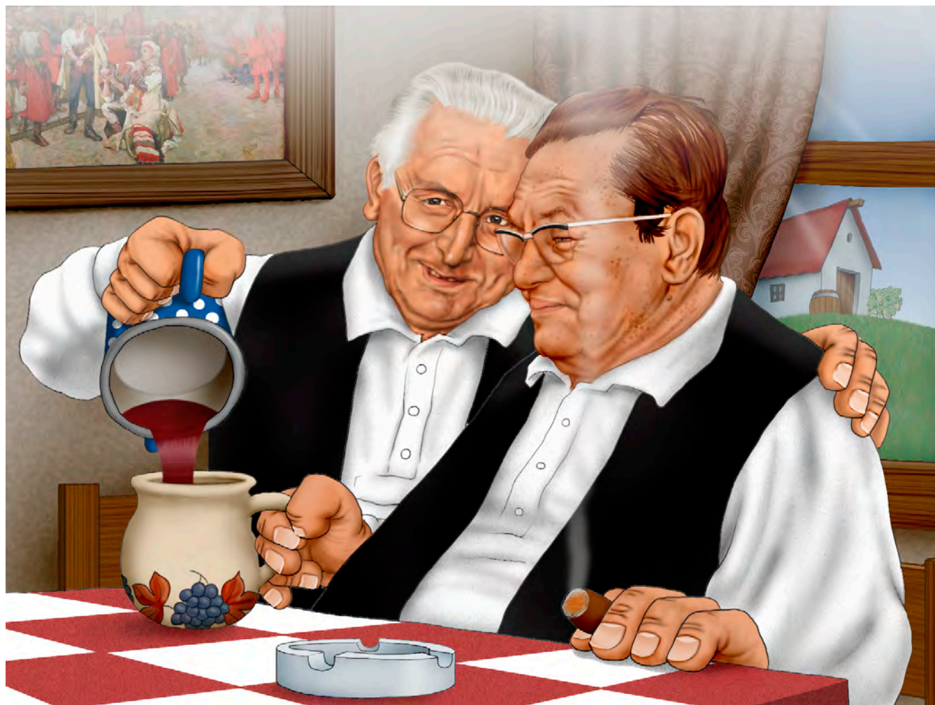
Prva nagrada na Festivalu karikature OROSLAVJE 2013.